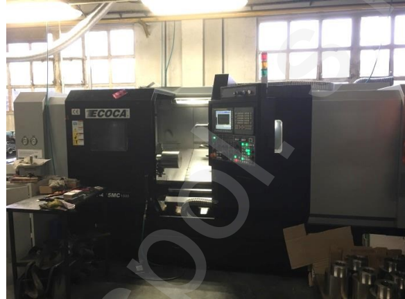
CNC soustruh ECOCA MT-415MC