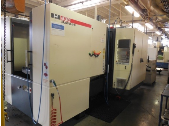
CNC obráběcí 4-osé centrum ZPS Tajmac H 630